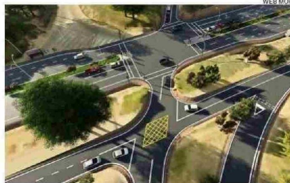
PROYECTO ESTÁ INSERTO EN CONCESIÓN RUTA 5 SUR TRAMO TEMUCO-RÍO BUENO.

"La 'opción 1' incluía soluciones integrales como el mejoramiento del enlace norte en Quinchilca, un enlace sur en el sector Los Pinos y un paso elevado en calle Conductor Núñez. Estas mejoras eran indispensables, especialmente considerando la construcción del nuevo hospital en el oriente y los grandes proyectos habitacionales en esa misma zona. Si bien implicaban afectaciones y expropiaciones, cuyos costos fueron infravalorados, respondían al crecimiento comunal y a la urgente necesidad de vías