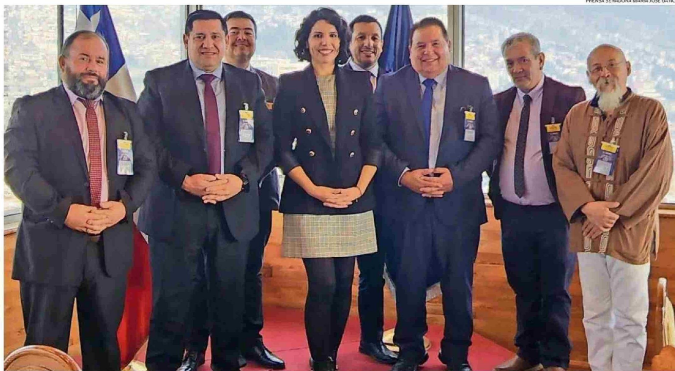
EN LA SESIÓN DEL MIÉRCOLES DE LA COMISIÓN DE OBRAS PÚBLICAS DEL SENADO FUE ABORDADO EL PROYECTO BYPASS PARA LOS LAGOS. PARTICIPARON REPRESENTANTES DE LA COMUNA.