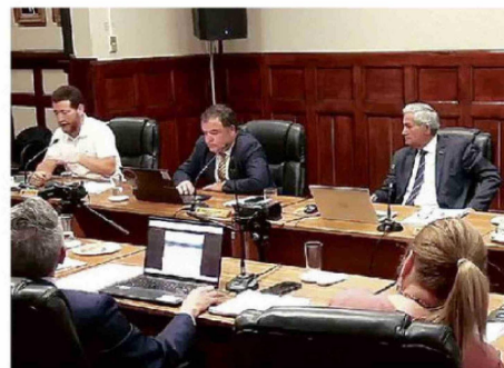
SE EXPUSO EN EL ÚLTIMO CONCEJO, QUE FUE LA SEMANA PASADA.

En el desglose por financiamiento del Gobierno Regional, se informó que a través del subítem 29, línea que permite la adquisición de activos y equipamiento, se encuentran aprobados proyectos por $338 millones. Estos recursos consideran la compra de un camión tolva con grúa Ampliroll y la reposición de vehículos para el Departamento de Operaciones, los que deberían financiarse durante el presente año.