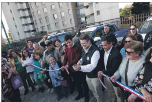
Claudio Orrego, gobernador de la Región Metropolitana y el alcalde Agustín Iglesias, acompañados del concejal Manuel Jara y vecinos de Independencia, realizan el tradicional corte de cinta que marca la entrega oficial de los vehículos a la comunidad.