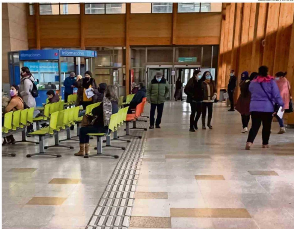
EL EX MINISTRO ENRIQUE PARIS COINCIDE EN MEJORAR LA GESTIÓN, PERO CUESTIONA LA DISMINUCIÓN DE RECURSOS EN ÁREAS CRÍTICAS.