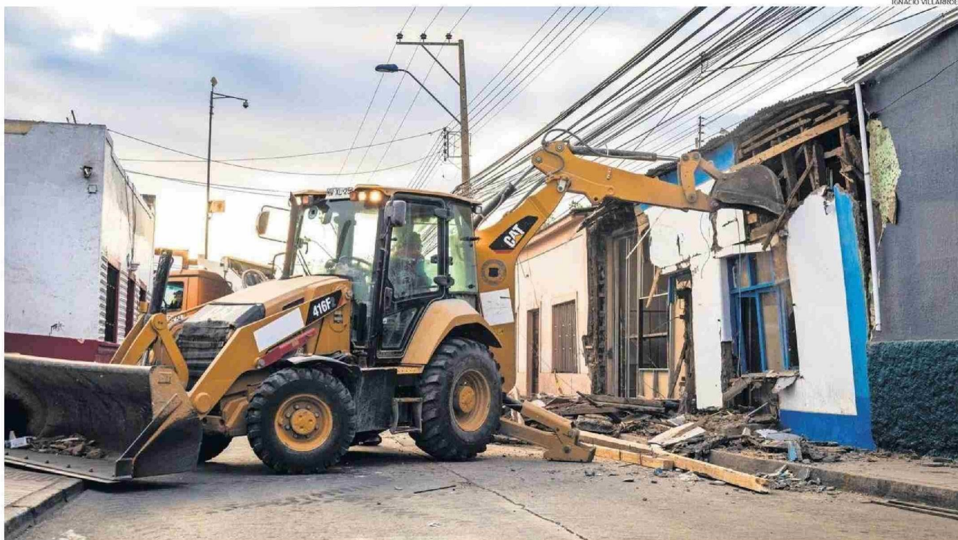
CON MAQUINARIA PESADA Y LA AYUDA DE TODO EL EQUIPO MUNICIPAL SE DERRIBÓ LA FACHADA DEL RESTAURANTE "EL CISNE" DE CALLE CHAÑARCILLO DE COPIAPÓ.