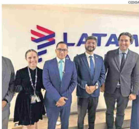
PARTICIPANTES DE LA MESA DE TRABAJO PÚBLICO-PRIVADA.

zona norte vía aérea debe ser una prioridad.