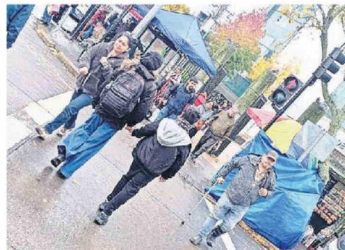
MUCHOS PACIENTES INGRESAN POR ESE ACCESO DEL HOSPITAL.

Agregó que “han habido situaciones de violencia entre los ambulan-