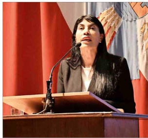
Mientras los estudiantes protestaban afuera del Aula Magna, Lincoala daba una charla sobre el rol del ministerio y el auge de la inteligencia artificial.

Actores del mundo educativo alertan sobre las consecuencias de la escalada de incidentes de las últimas semanas. La Moneda presentará una querrela por atentado contra la autoridad.