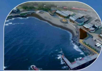
Mejoramiento de la playa Pacheco Altamirano