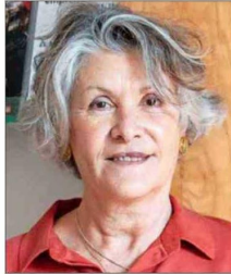
ID: MICA 7093825

Otro de los puntos que valora es cómo esas evaluaciones permiten distinguir la brecha entre las notas escolares y los aprendizajes efectivos que poseen los estudiantes: "Si uno compara los resultados Simce