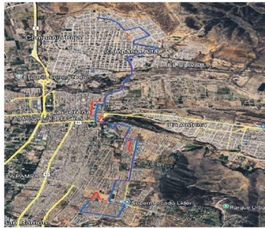
Servicio E04: Las Compañías - Centro de la Serena - Barrio Universitario - Hospital La Serena