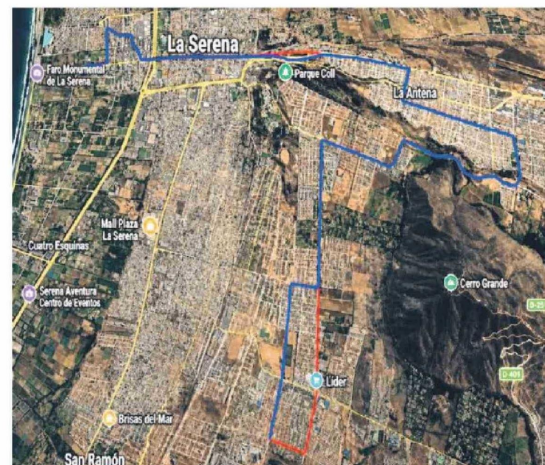
Servicio E06: El Faro - Pueras del Mar - Centro La Serena - La Florida - Colina del Pino - Hospital La Serena