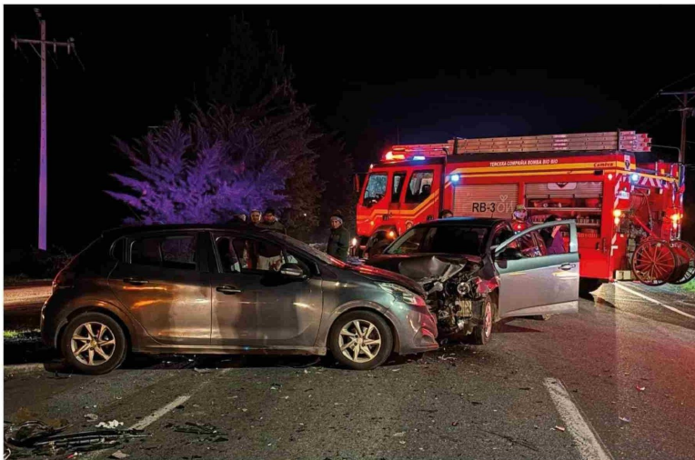
EL TRAMO CON MAYOR accidentabilidad se ubica entre los kilómetros 34 y 24,6.

La autoridad enfatizó que, pese a valorar el flujo vehicular como parte del desarrollo comunal, es inaceptable mantener una