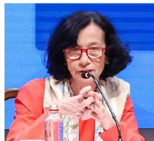
Rosanna Costa, presidenta del Banco Cen-