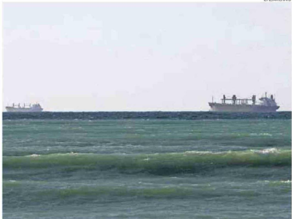
BARCOS PETROLEROS CRUZAN EL ESTRECHO DE ORMUZ.

tomada por Teherán ha tenido duros efectos en la economía chilena, especialmente en el tipo de cambio, en las expectativas inflacionarias y en el precio del cobre.