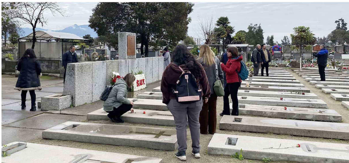
Este martes, en Rancagua, se realizó una romería para recordar la peor tragedia en la minería nacional.

Tiraje: 5.000 Lectoría: 15.000 Favorabilidad: No Definida