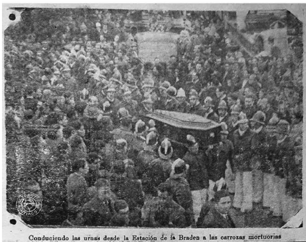
Conduciendo las urnas desde la Estación de la Braden a las carrozas mortuorias

Imagen del funeral, publicada por El Rancagüino en 1945.