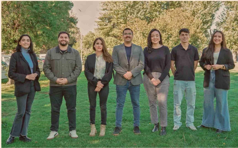
Equipo de Transferencia Tecnológica UFRO.

En materia de licenciamiento, entre 2025 y lo que va de 2026, la Universidad registra 13 licencias tecnológicas entre formalizadas y en gestión, en donde además desde el 2024 percibe ingresos por licenciamiento, lo que respalda que las tecnologías UFRO están