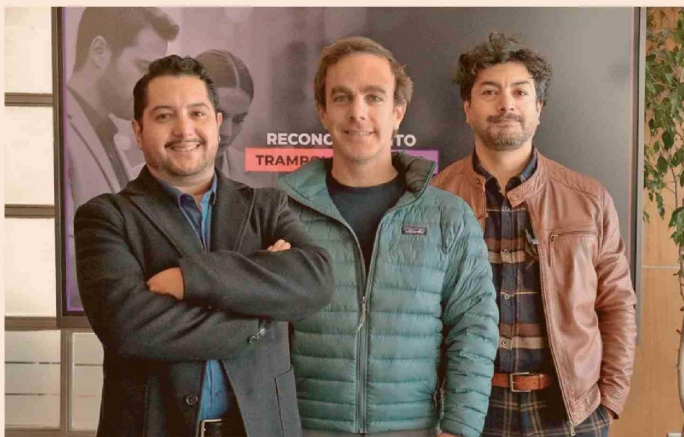
Ganadores Reconocimiento Trampolín Lab 2025-2026

La experiencia de la Coordinación de Transferencia Tecnológica de la UFRO demuestra que el desafío no es sólo gestionar tecnologías, sino también canalizar la investigación mediante vías de transferencia tecnológica adecuadas, favoreciendo su proyección desde La Araucanía.