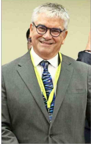
Mario Marcel respaldó a Grau y aseguró que no existen los errores señalados por el Gobierno.

El diagnóstico de los ex secretarios de Estado es que luego del cambio de gabinete realizado por el Presidente José Antonio Kast, el Ejecutivo, en vez de admitir errores, iba a buscar un “chivo expiatorio” para desviar la atención. Ello, estiman, se dio a partir de este lunes, cuando el