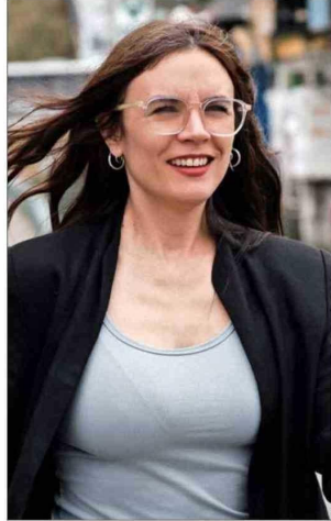
Camila Vallejo reapareció para criticar las declaraciones del ministro Martín Arrau.