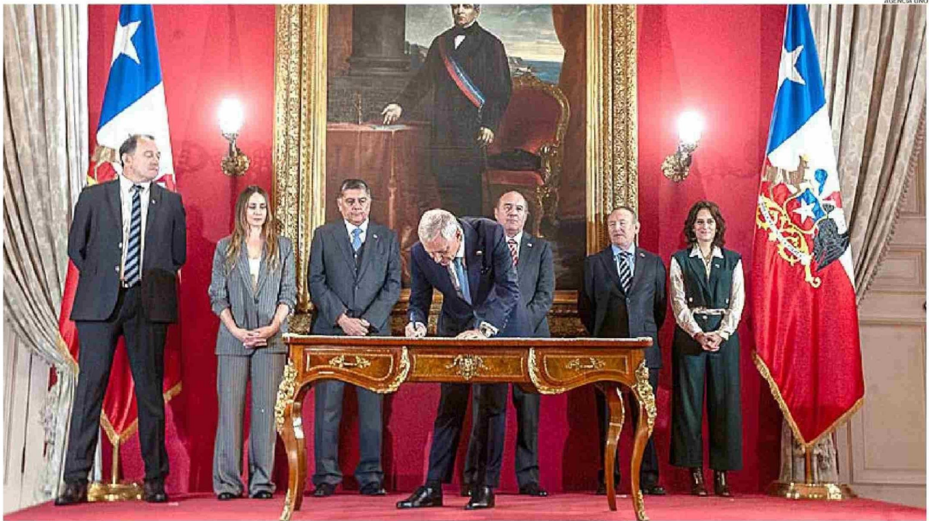
ACOMPAÑADO DE PARTE DE SU GABINETE, EL PRESIDENTE JOSÉ ANTONIO KAST FIRMÓ EL PASADO MIÉRCOLES EL PROYECTO DE LEY QUE PRETENDE DINAMIZAR LA ECONOMÍA NACIONAL.