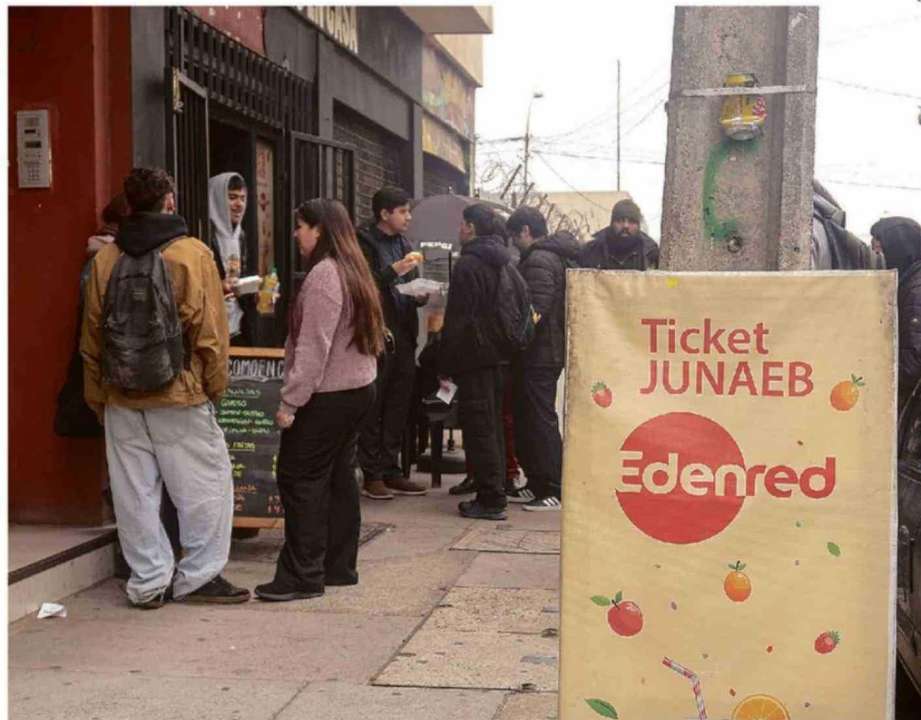
UNIVERSITARIOS PREFIEREN LA COMIDA RÁPIDA DEBIDO A LA RELACIÓN PRECIO-CALIDAD Y LA NECESIDAD DE QUEDAR SATISFECHOS.

Aunque el Gobierno aseguró posteriormente que no existirán recortes en alimentación escolar y que la continuidad de las prestaciones está garantizada, sí reconoció la necesidad de revisar la ejecución y fiscalización de estos programas para mejorar la eficiencia del gasto público. En los colegios y hogares de la Región de Valparaíso, esa discusión