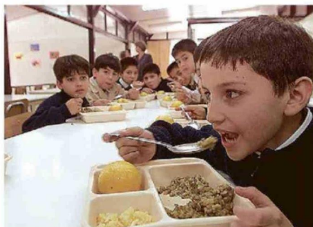
MÁS DE 167 MIL ESTUDIANTES RECIBEN ALIMENTACIÓN DIARIA A TRAVÉS DE JUNAEB EN LA REGIÓN.

El alza sostenida en el precio de los alimentos también aparece como uno de los principales focos de preocupación dentro de las comunidades educativas. Desde los gremios advierten que mantener presupuestos similares en un escenario inflacionario podría traducirse en menos raciones, reducción de porciones o una mayor pre-