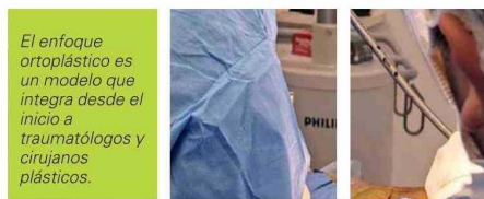
El enfoque ortopédico es un modelo que integra desde el inicio a traumatólogos y cirujanos plásticos.