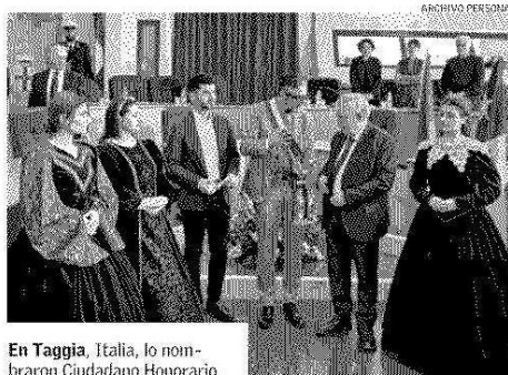
En Taggia, Italia, lo nombraron Ciudadano Honorario.

marca de por vida. Lo que queda como sedimento de todo ese período es, en dos palabras, responsabilidad política. O sea, yo nunca, cuando fui autoridad ni en la universidad ni en ninguna parte, hice nada que pudiera facilitar que volviera a haber un golpe de estado".