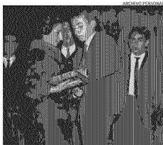
En 1966, recibió el premio al mejor alumno de su promoción en el liceo. Se lo entregó su madre.