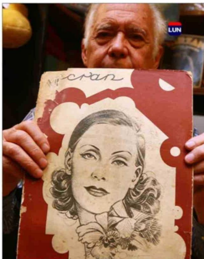
La primera Ecran en español con Greta Garbo en portada.

a moverse rápido. Copió películas cuando todavía no existían carátulas ni grandes distribuidoras instaladas, abrió videoclubes en La Florida y Puente Alto y más tarde fue cliente pionero de Video Chile. Recuerda que en esos años el negocio funcionaba tan bien que la plata "terminaba guardada en bolsas". El verdadero giro vino en un viaje a Estados Unidos. Ahí entró a una pequeña tienda en Longwood donde vendían cómics en inglés y también películas antiguas. Salió de ahí con una idea: dedicarse a las películas viejas, las