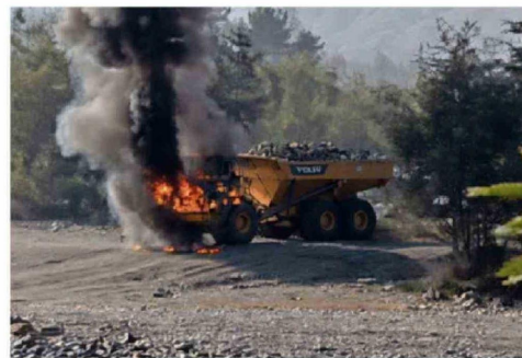
EL MARTES EN LA TARDE ATACARON PLANTA DE ÁRIDOS EN LAUTARO.