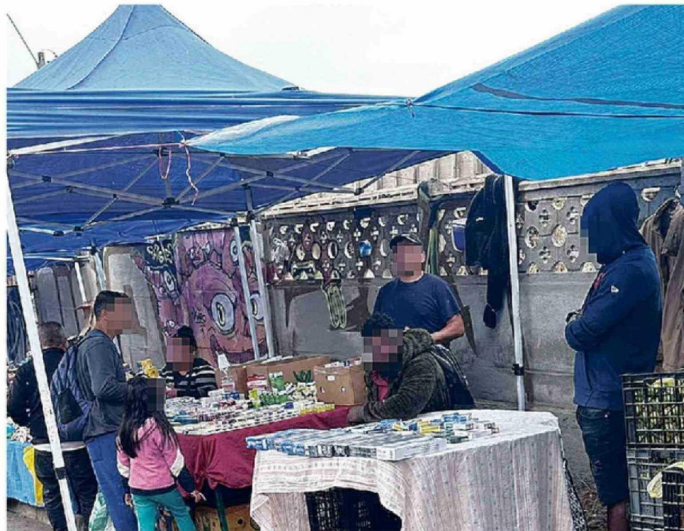
EN LAS FERIAS LIBRES ES FÁCIL ENCONTRAR CIGARRILLOS DE CONTRABANDO.

Es difícil creer que quienes desarrollan esta red global de internación de cargas ilegales solo lo hagan para internar cigarrillos ilegales y no otro tipo de sustancias más nocivas que son producidas en el continente asiático, tales como metanfetaminas, fentanilo, éxtasis (Mdma), entre otras. El contrabando de cigarrillos bien puede estar relacionado con la