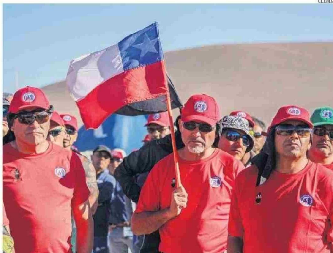
LOS PROCESOS DE NEGOCIACIÓN COLECTIVA DEL SINDICATO N°1 DE ESCONDIDA HAN MARCADO VARIOS HITOS.

Los dirigentes, que se reunieron en Hornitos, al sur de Antofagasta, informaron además que "en las próximas semanas se realizará un proceso de difusión ante las bases, para luego realizar asambleas extraordinarias y votaciones en las que se deberán pronunciar los socios, para acordar la creación de la Federación".