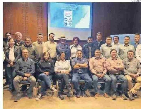
LOS DIRECTORIOS SE DIERON CITA DOS DÍAS EN HORNITOS, ANTOFAGASTA.