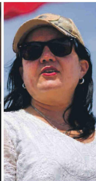
Cuestionamientos a la ministra Steinert por su vínculo comercial con su exmarido – abogado que defendió a un imputado por narcotráfico– desatan disputa con el senador Núñez.

zas o violencia. Además, propone crear el delito de "usura extorsiva", aumentar las penas cuando exista habitualidad o vínculo con el crimen organizado, e incorporarlo como base para el lavado de activos.