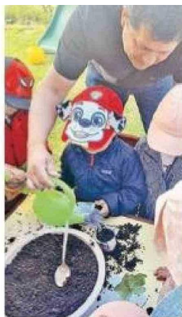
Preparando la tierra previo a la siembra de semillas de lechuga.