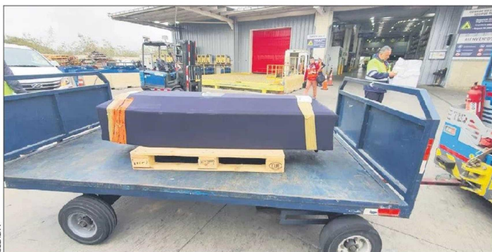
El féretro del Mota llegó a Chile a las 11 de la mañana de este viernes.

La madrugada de este sábado carabineros debió irrumpir en el barrio con un carro lanzagua y gases lacrimógenos para dispersar a los amigos que lanzaban fuegos artificiales.