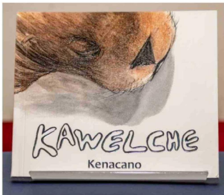
EL AUTOR DEFINE A “KAWELCHE” COMO UN LIBRO ÁLBUM.