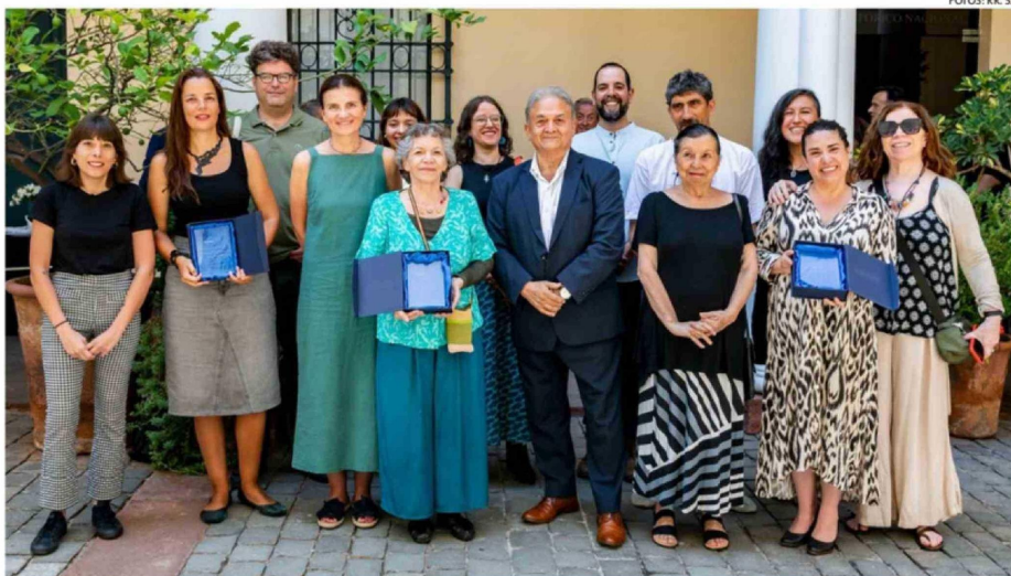
EN LA PREMIACIÓN NACIONAL FUERON DESTACADAS TRES OBRAS PUBLICADAS POR EDITORIALES CHILENAS EN EL 2025.

Dentro de esa misma línea, Kenacano profundizó en el contenido de la obra y su vínculo con la cosmovisión chilota. “Es un libro álbum, por lo tanto, la mayor parte son ilustraciones que cuenta con 70 páginas, con mucho color, que narra la historia de estas personas que cuando naufragan mueren en el mar o se convierten en otros seres, que es el Cahuelche y tiene que ver con la cosmovisión de Chi-