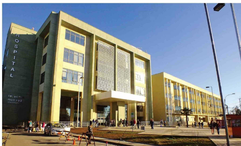
EL PRINCIPAL RECINTO ASISTENCIAL de la provincia de Biobío enfrenta un escenario de ajuste presupuestario en el marco de una modificación de recursos del sistema público de salud, mientras autoridades descartan impactos en la atención de pacientes.

Las declaraciones las realizó en la capital provincial el subsecretario de Redes Asistenciales, Julio Montt, quien aclaró que la medida se enmarca en el Decreto 333 del Ministerio de Hacienda y que el concepto correcto es "ajuste presupuestario" y no "recorte".