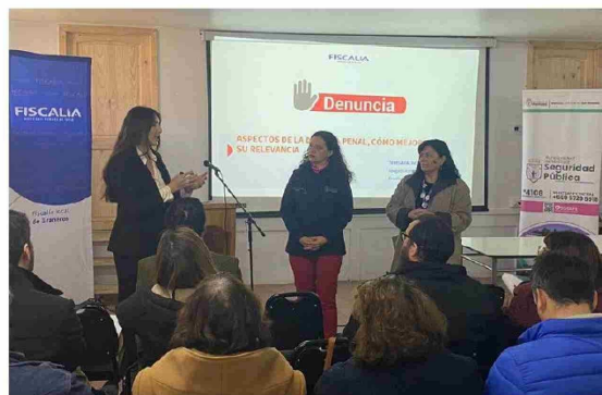
Fue una jornada informativa dirigida a directores de establecimientos educacionales de la comuna.