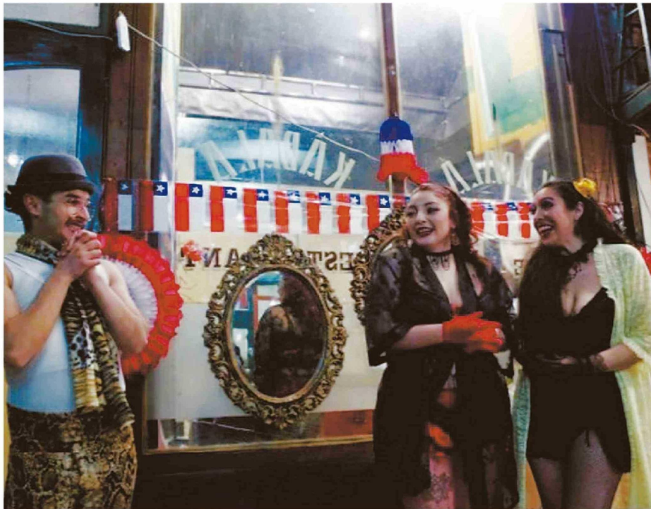
EL TRABAJO EN EL RUBRO ARTÍSTICO SE CARACTERIZA POR SU INTERMITENCIA Y LA ESCASEZ DE VÍNCULOS LABORALES FORMALES.

“En mi caso particular, cotizaciones no tengo. O sea, mañana, pasado, llega la hora de jubilar, y si sigo con esta vida de trabajar en el arte, ganando para el día a día, yo no voy a tener jubilación. (...) Al final, he ahí la frase: voy a hacerlo aunque sea por el amor al arte. La precariedad en el arte tiene muchos flancos