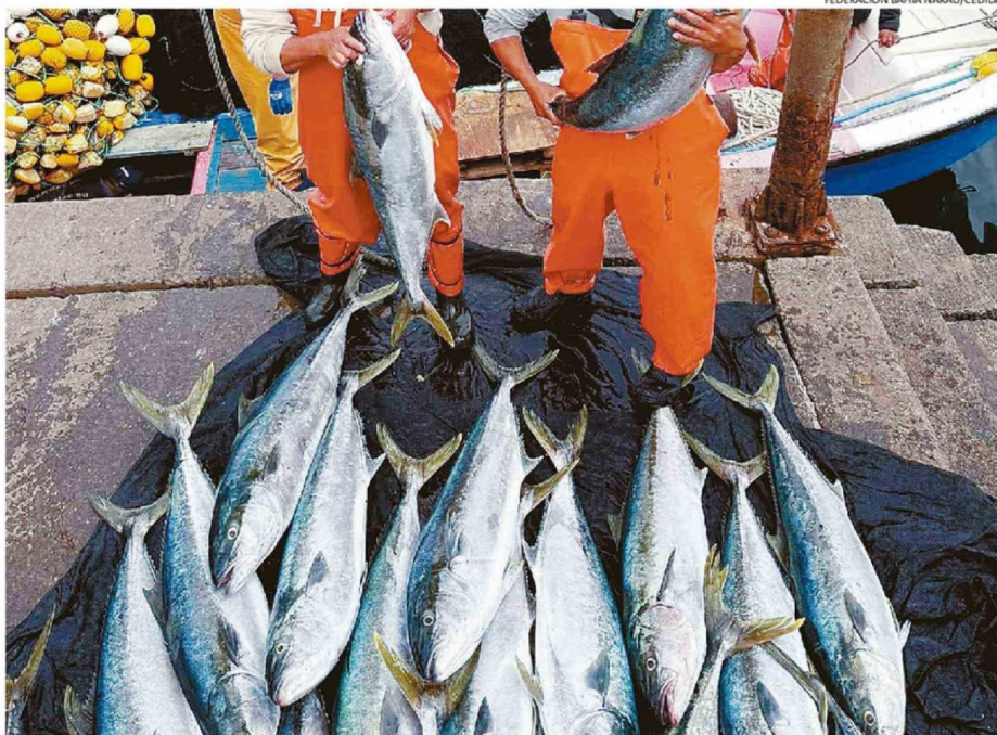
AGRICULTORES, AGROPECUARIOS Y PESQUEROS SON LOS TRABAJADORES CON MAYOR TASA DE INFORMALIDAD EN LA REGIÓN.

Históricamente, y tal como en la actualidad, el empleo informal se ha concentrado en dos categorías: trabajadores por