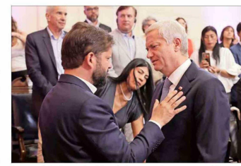
Los mandatarios en ejercicio y electo se encontraron ayer en el Congreso del Futuro.

eternamente si aprobamos o no aprobamos el FES (financiamiento de la educación superior), pero veamos qué es lo más importante. ¿No será más importante el tema de la sala cuna? ¿No será más importante la educación de la primera infancia?", continuó.