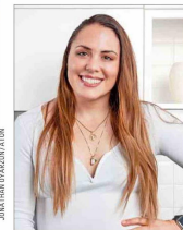
La atleta Natalia Duco se perfila como titular del Deporte en el próximo gabinete, según se comenta, por recomendación de figuras de Evópoli. Eso sí, algunos son críticos de que se le de la cartera a una persona que estuvo suspendida por tres años en su especialidad, el lanzamiento de bala, al haber dado positivo en doping.