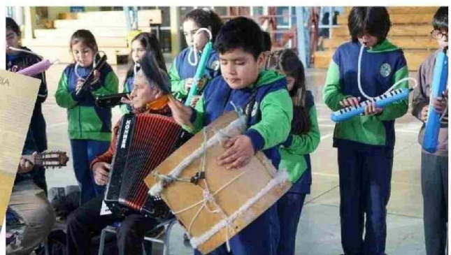
LA INAUGURACIÓN FUE AMENIZADA POR ALUMNOS MUSICOS DE LA ESCUELA DE VILLA NERCÓN.

lar. Lo que queremos es rescatar una historia olvidada, visibilizar por qué Chiloé fue marginado tras su anexión y reflexionar sobre el futuro del Archipiélago”.