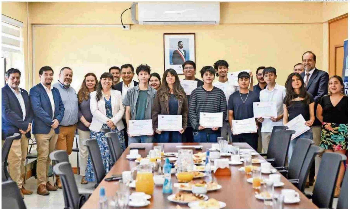
MIGUEL A. BUSTOS/UNO NOTICIAS.

María Alejandra Pino C. mariaalejandra.pino@australvaldivia.cl