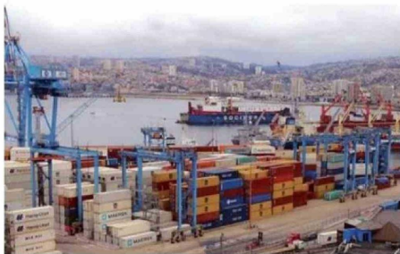
VALPARAÍSO SUBIÓ DE UN NIVEL BAJO A MEDIO BAJO.

A raíz de estos resultados, desde el municipio se refirieron a través de un comunicado, en el cual aseguraron que valoran