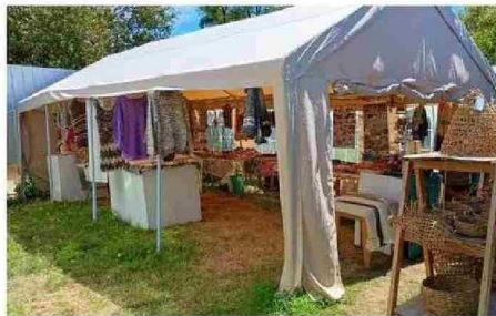
SE DISPUSO DE UN SECTOR CERCANO PARA LOS ARTESANOS.

Las obras consideran una intervención completa, que incluye el recambio de revestimientos exterior