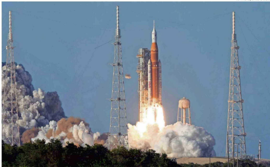
EL DESPEGUE OCURRIÓ SEGÚN LO PREVISTO, PASADAS LAS 19:30 HORAS EN CHILE.

NASA mantuvo una transmisión ininterrumpida del último amanecer sobre la Tierra de los tripulantes.