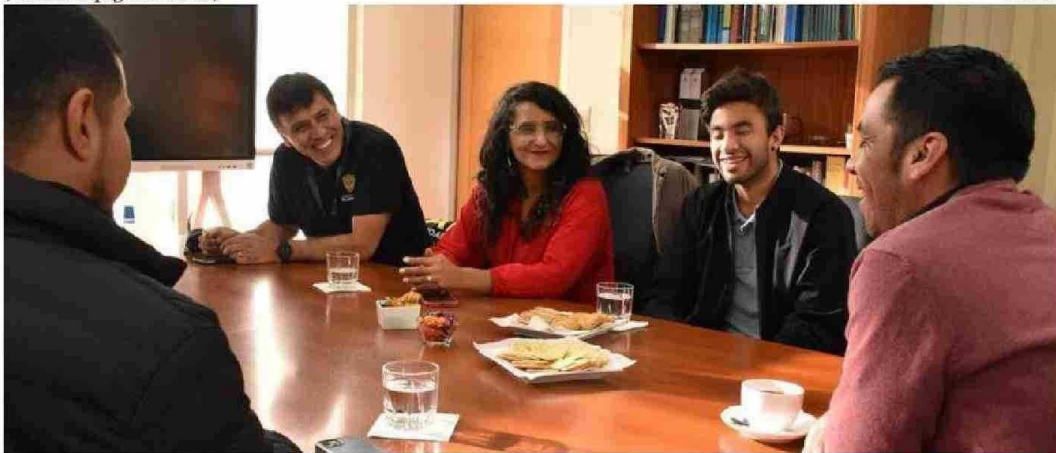
LA INICIATIVA DEL ESTABLECIMIENTO CONSOLIDA EL APORTE AL DEPORTE ADAPTADO Y EL DESARROLLO INTEGRAL DE SUS ESTUDIANTES.

Tenemos a distintos estudiantes que desarrollan deportes aquí al interior de la universidad, que son parte del Departamento de Inclusión. Pero es la primera vez que gestionamos y logramos concretar este apoyo para un estudiante con diversidad funcional, con discapacidad, a nombre de la Universidad Atacama”.