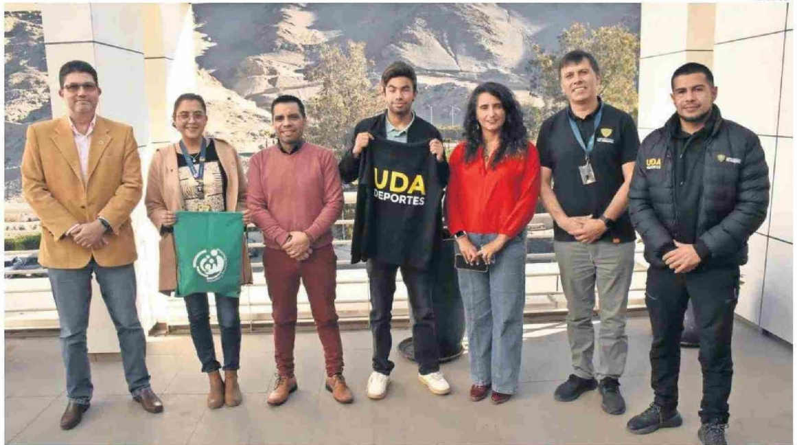
DEBIDO AL APOYO INSTITUCIONAL EL ATLETA DE GOALBALL, PODRÁ PARTICIPAR EN EL CAMPEONATO REGIONAL SUDESTE 1 EN BRASIL.

El goalball es el único deporte paralímpico creado específicamente para personas ciegas y con discapacidad visual. Se juega entre dos equipos de tres personas en cancha cada uno, quienes deben lanzar una pelota con cascabeles hacia la portería contraria, utilizando el oído como principal herramienta de orientación. "Este deporte que practico que es el goalball, no se ve mucho, no se apoya mucho. Entonces, igual es de agradecer que se fijen en un deporte que quiere surgir, y que vamos a jugar en una competencia internacional." añadió el deportista.