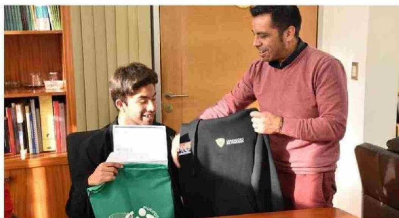
ESTA ES UNA INSTANCIA PIONERA.