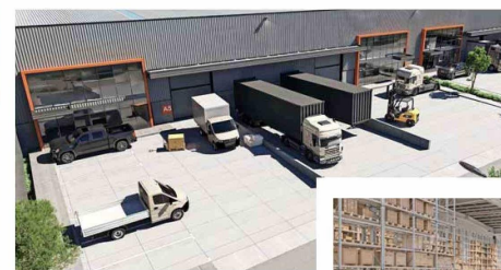
Su patio de descarga y bodegas interiores permiten operar de manera cómoda y segura.