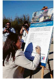
EL TERRENO ES MUNICIPAL.