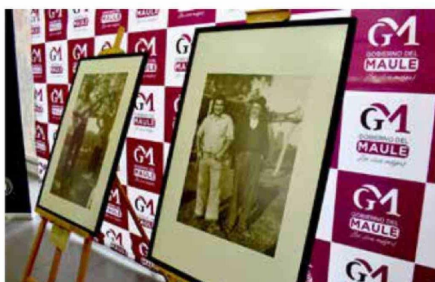
Las imágenes narraban la cotidianidad de aquellos que dieron vida a la casona.