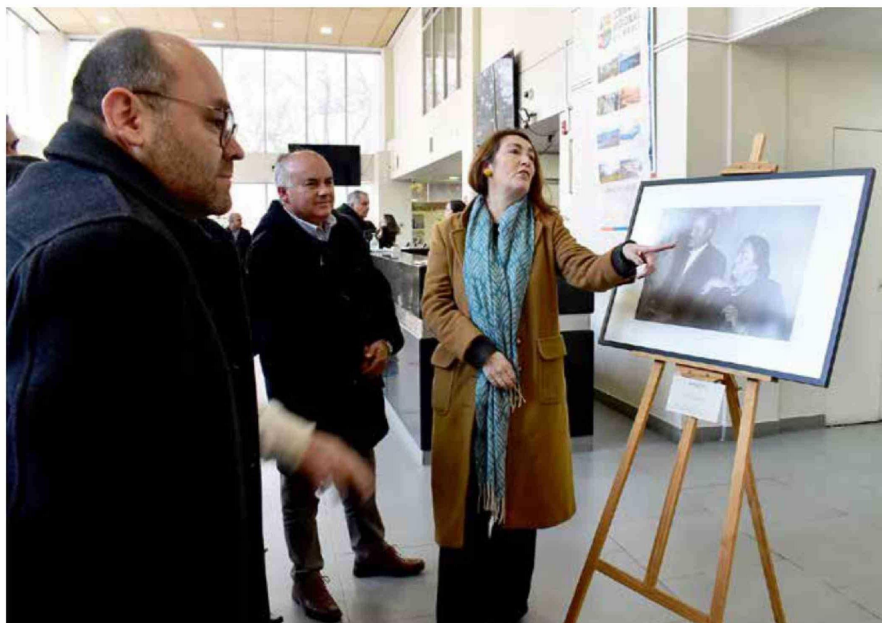
Las piezas se encontrarán gratuitamente expuestas en el primer piso del edificio de la Gobernación Regional.

EN EL EDIFICIO DE LA GOBERNACIÓN REGIONAL SE EXPUSIERON LAS PIEZAS