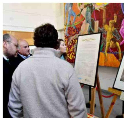
Las fotografías se exhibirán hasta el próximo 30 de junio.

• La casa de estudios, a través de su Centro de Extensión, movilizó la colección hasta el edificio frente a la Plaza de Armas para narrar la historia del Maule antiguo en este céntrico lugar.