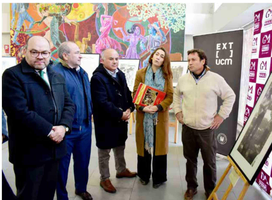
Representantes del Centro de Extensión de la UCM encabezaron el recorrido para explicar y contextualizar a los presentes.