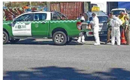
EL HECHO SE PRODUJO EN UN SECTOR CÉNTRICO DE LA CIUDAD.

Al desagregar por sexo, los hombres registraron un promedio de 40,1 horas semanales, mientras que las mujeres 35,4 horas. En cuanto a las jornadas habituales, la caída de la población ocupada estuvo marcada principalmente por la disminución de quienes trabajaban 45 horas semanales, grupo que retrocedió un 36,1% en un año. Asimismo, los trabajadores con jornadas de 46 horas o más presentaron una baja de 1,7%.