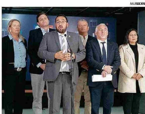
LA REUNIÓN EN SANTIAGO.

Título: Alcalde solicita que los colegios de Algarrobo no se traspasen al Estado