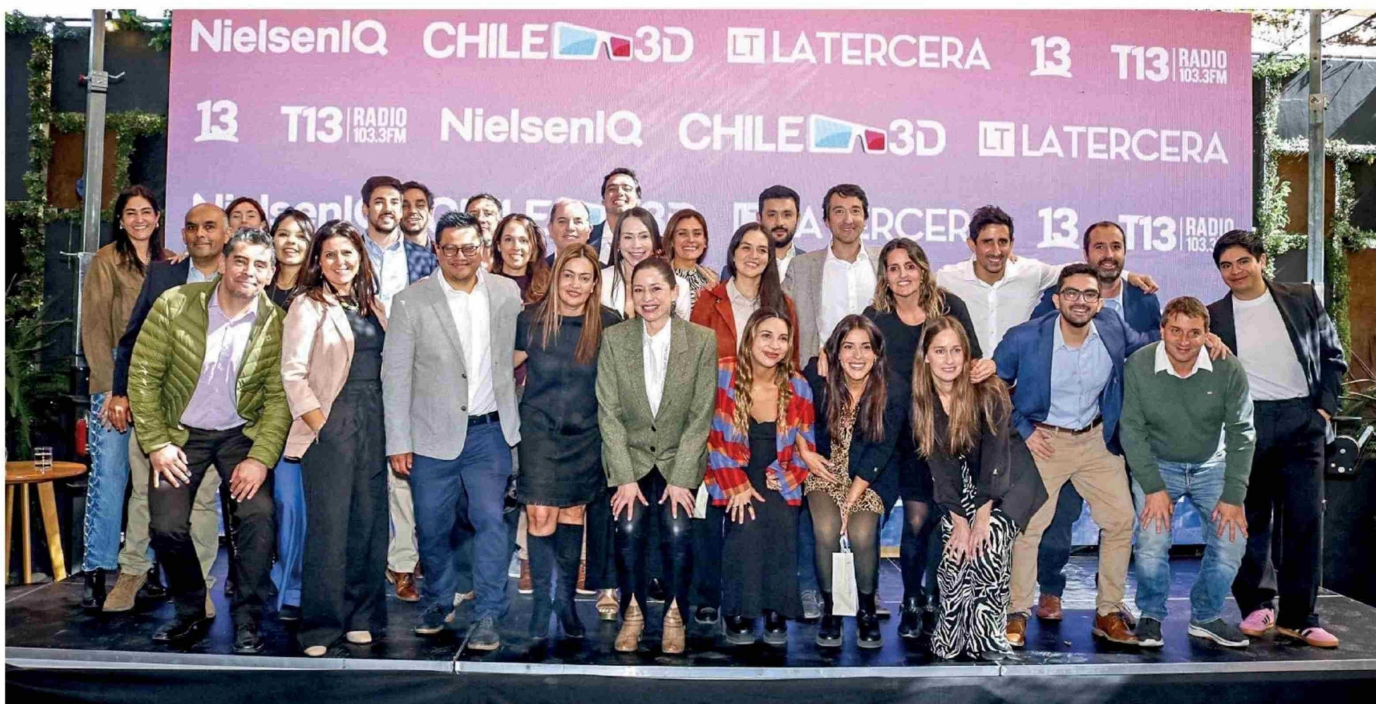
▲ Equipo de NielsenIQ presente en la ceremonia CHILE3D, responsables del estudio que reconoce la preferencia de los consumidores.