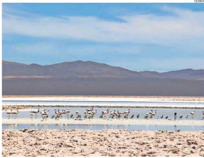
PEINE DIJO QUE LAS CONSIDERACIONES ECONÓMICAS COMPROMETEN SU SUBSISTENCIA MATERIAL Y CULTURAL.

además, los ministros de Salud, May Chomalí; de Economía, Fomento y Turismo y Minería, Daniel Mas; y de Agricultura, Jaime Campos, quienes evaluaron los antecedentes técnicos y ambientales presentados en el recurso de reclamación del titular antes de resolver favorablemente la iniciativa. Con esta decisión, el proyecto SLM NX Uno de Peine logra destrabar su tramitación ambiental y avanzar hacia su desarrollo productivo en la comuna de San Pedro de Atacama, en una zona donde la explotación