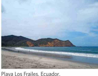
Playa Los Frailes, Ecuador.