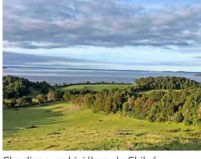
Chaulinec, archipiélago de Chiloé.