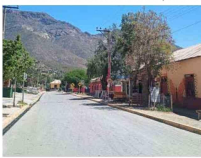
Tuluahuén, valle de Limarí.