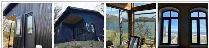
Ventanas de Daño. Tercera y Cuarta de Seguridad

Los servicios de inteligencia del Reino Unido informaron que Rusia ha llevado a cabo esta semana “tres de los mayores ataques con drones” contra Ucrania.