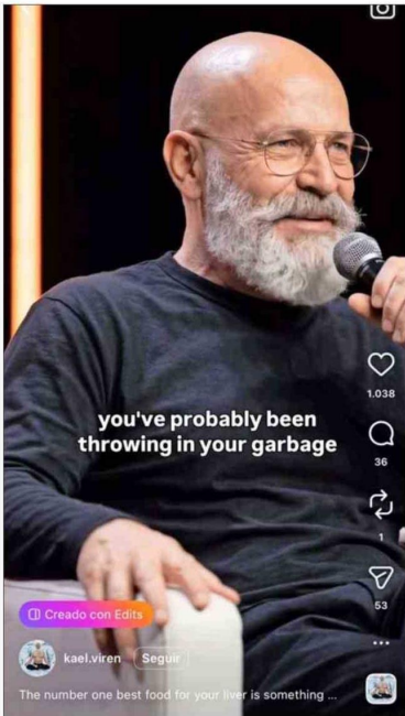
Un formato común es el de un entrenador o gurú fitness siendo entrevistado sobre su método de entrenamiento o de alimentación. Este perfil, por ejemplo, tiene más de 68 mil seguidores en Instagram. La mayoría de estas IA hablan en inglés.

cargas de entrenamiento”, pero advierte que no debería usarse “pensando en lograr el cuerpo de un entrenador con IA” ni seguir estrictamente sus consejos.