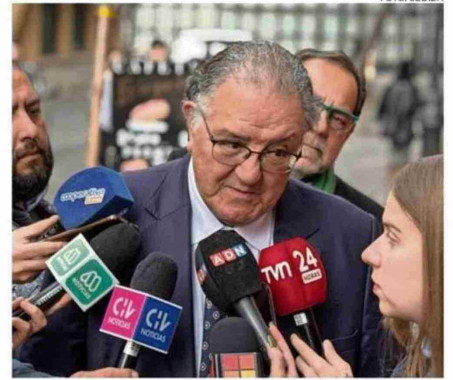
"ESTO ES COMO QUERER DESACTIVAR LA CONADI", OPINA HUENCHUMILLA.